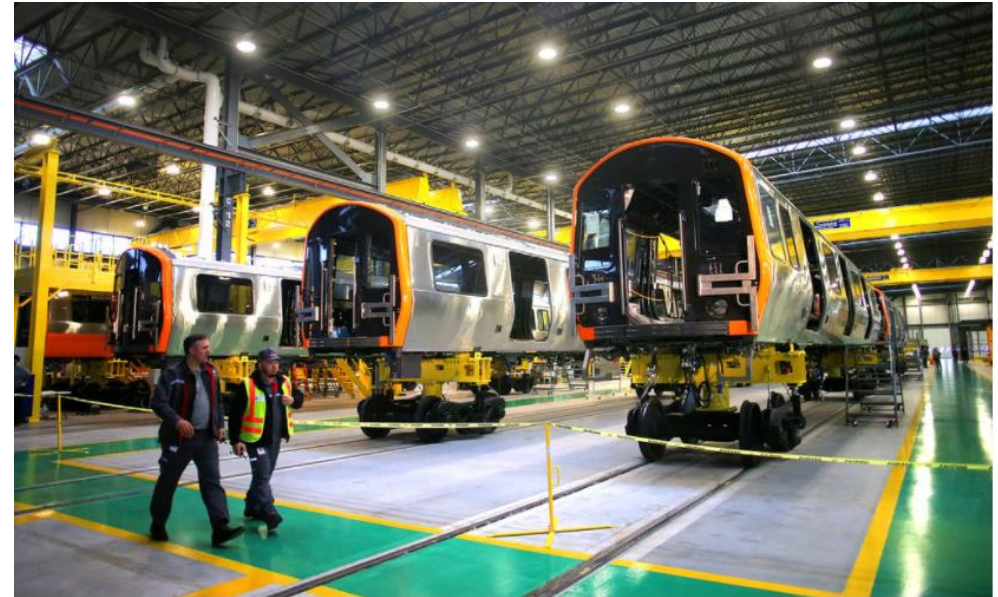
Foto: Planta CRRC en Springfield, Massachusetts, EUA

https://expansion.mx/empresas/2021/05/12/crrc-planta-trenes-para-latinoamerica-en-mexico